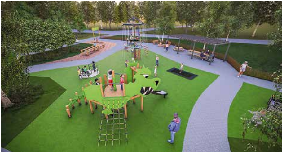
LEK MED DINO: Skissen visar vision för Dinosaurielekpark som byggs i Sundsvall.