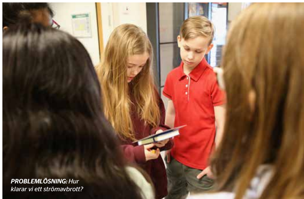
PROBLEMLÖSNING: Hur klarar vi ett strömvabrott?