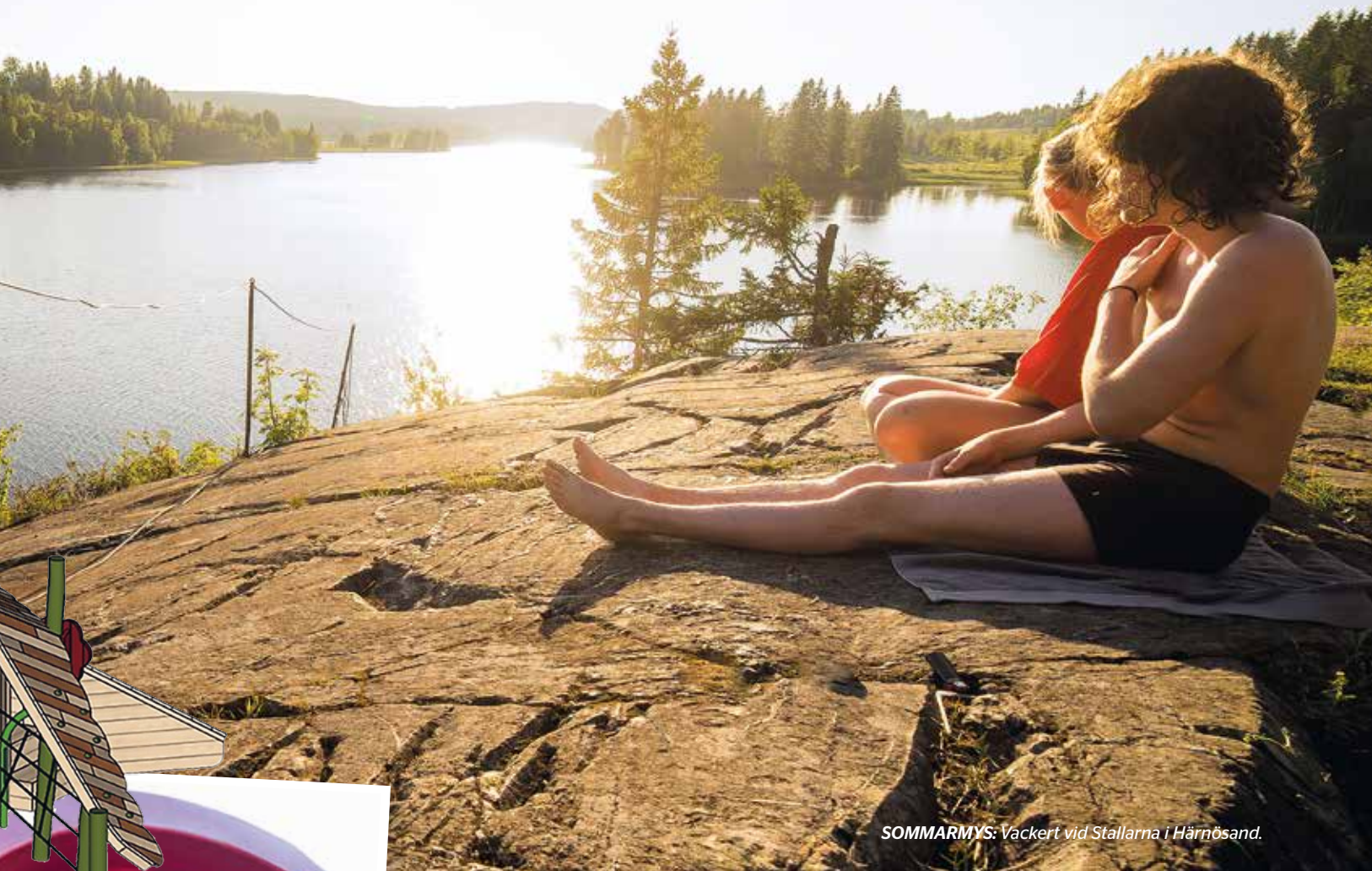
SOMMARMYS: Vackert vid Stallarna i Härnösand.