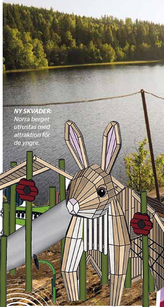
NY SKVADER: Norra berget utrustas med attraktion för de yngre.

– Det betyder mycket, barnen vill ju vara aktiva och blir glada när vi gör utflykter. Det i sin tur gör det lite enklare att vara förälder! ■