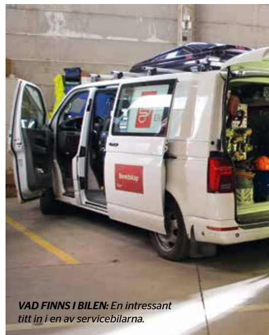
VAD FINNS I BILEN: En intressant titt in i en av servicebilarna.