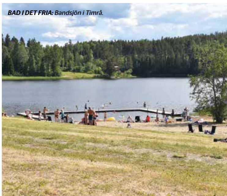
BAD I DET FRIA: Bandsjön i Timrå.