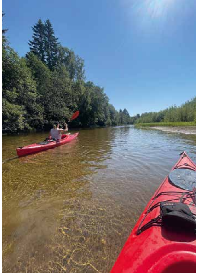
PÅ GLID I DELTAT: Så här kan det se ut för den som hyr kajak i Indalsälvens delta.