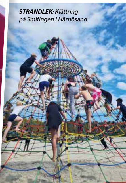
STRANDLEK: Klättring på Smitingen i Härnösand.