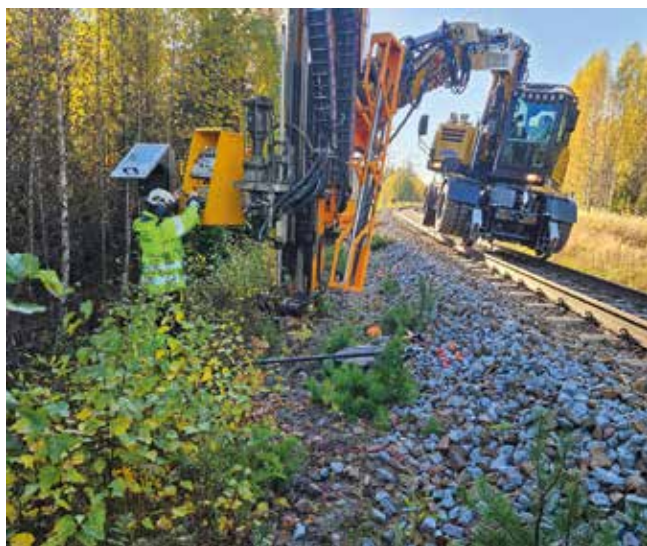
Sondering och provtagning för kontaktledningsbyte med hjälp av borrarregat för grävmaskin

Vill du veta mer? Besök vår hemsida: www.tyrens.se