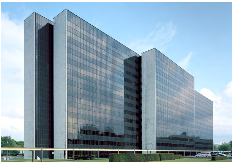
Kontorshus i Hamburg, Arkitekt: Arne Jacobsen, 1961

Referensbilder med exempel på solitära byggnader med stark volymverkan.