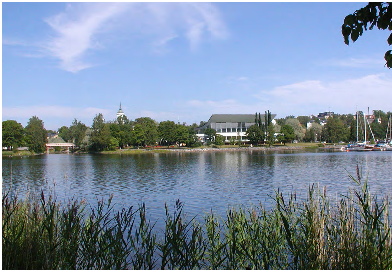
Kanaludden sedd från Gådeåparken

Platsen präglas i stor grad av närheten till vattnet och av Simhallens starka närvaro som ett solitärt objekt på strandkanten. Simhallen är byggd på 70-talet och har ett stort välvt tak som är mycket karaktäristiskt, samt en sluten sockelväning som understryker simhallens skulpturala egenskaper. Sommartid har platsen en grönskande parkliknande karaktär med höga träd och gräsytor. De öppna vattenytorna ihop med kanalen ger också platsen en attraktionskraft samt gör att tomten ligger i blickfånget från vattensidan. Från norr utgör tomten en plats mellan staden och vattnet som präglas av den närbelägna stadsdelen Östanbäckens uppbrutna bebyggelsekaraktär, en större väg (Brunnshusgatan) och simhallens slutna bottenvåning.