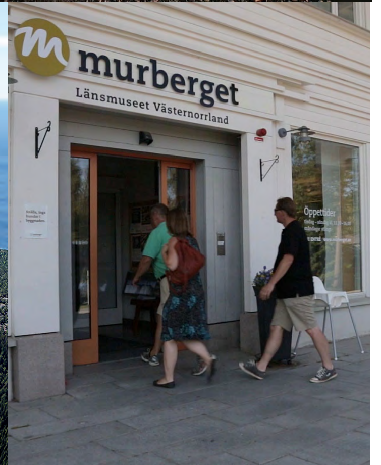
BILDER: Mellanholmens evenemangsområde ligger precis vid Kanaludden, Smitingens naturreservat med havsbad och Läns museet nås med bil/buss på mindre än 10 minuter.