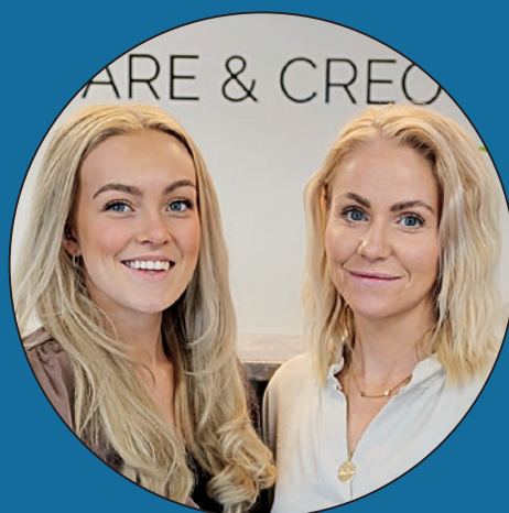
Care & Creo

...och fått hjälp och råd i företagsstarten av Nyföretagarcentrum i Härnösand